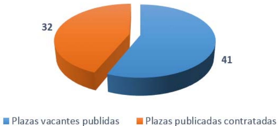
Cuadro 3: Plazas contratadas por Unidad