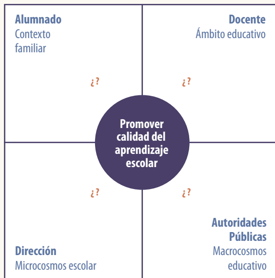
Figura 2. Herramienta para identificar usuarios potenciales de las evaluaciones dentro de una política de usos efectivos: Los actores en su contexto