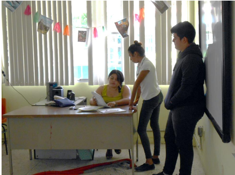
Figura 4. Espacio de atención individual para el orientador educativo.