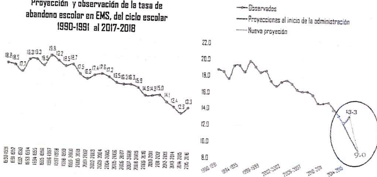
Proyección y observación de la tasa de abandono escolar en EMS, del ciclo escolar 1990-1991 al 2017-2018

En el ciclo escolar 2011-2012 la tasa de abandono fue de 15%. Actualmente es de 13.3% Sin embargo, todavía estamos lejos de alcanzar la meta de 9% del Programa Sectorial de Educación.