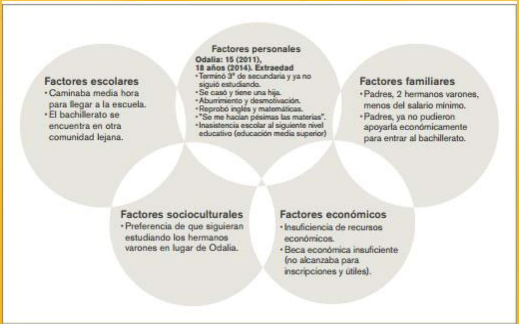
Figura 4: Madre adolescente que no siguió estudiando educación media superior