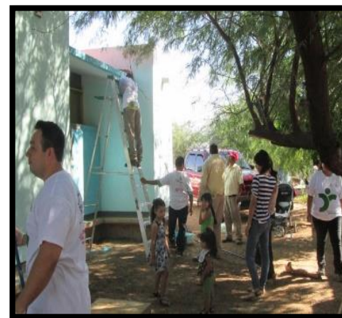
Evidencias octubre 2015: Jornadas de trabajo entre el colectivo docente y la comunidad de madres y padres de familia