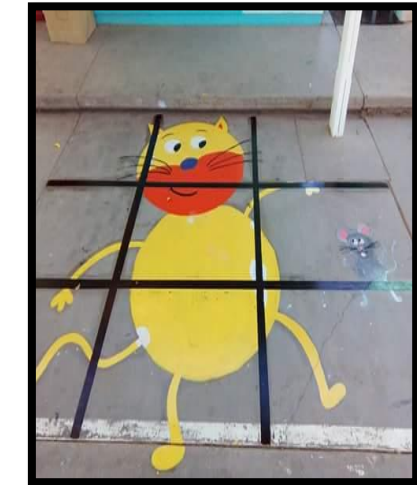
Evidencias de Octubre a Febrero 2016: Productos del trabajo realizado