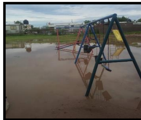
Evidencias de agosto 2015. Condiciones de la escuela antes de la Ruta de la Mejora