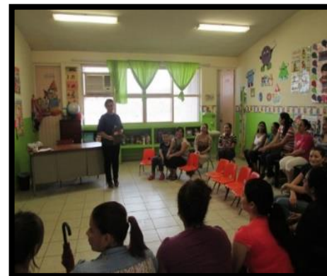
Reuniones con padres de familia