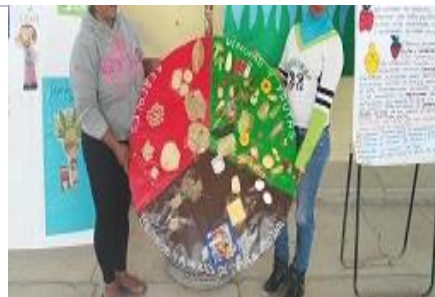
Exposición de temas por padres