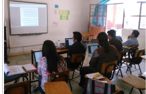
Sesiones de tutoría