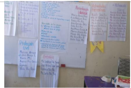
Organización de CEPS