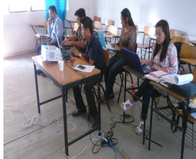
Compra de proyector