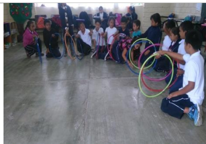
Observación de clases