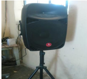
Equipo de sonido