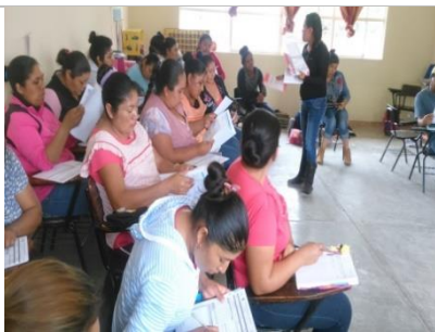
Reunión con padres