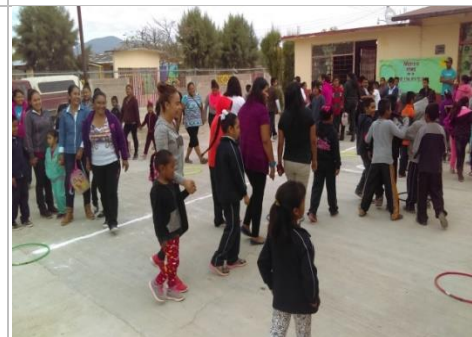
Trabajo colaborativo con padres de familia