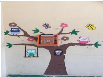
Árbol de lectura: depende de las lecturas de los alumnos se llena de hojas, flores y mariposas