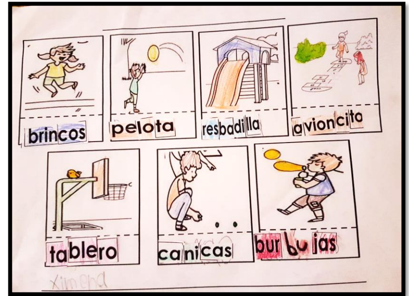
Imagen 4. Resultado de la actividad 3 de la sección “el recreo”, elaborada por una estudiante de 2º “B”.