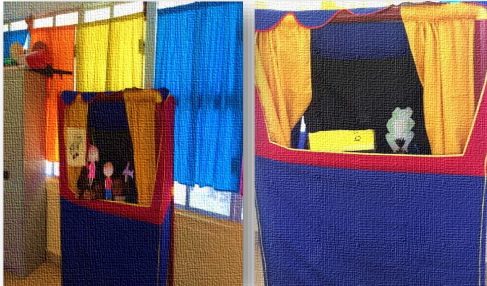
Imagen 3. Presentaciones de los títeres.

Durante la presentación de los alumnos, procuré que cada uno enfatizara en los cambios de voz de los personajes, así como en el movimiento de los títeres cuando se requería. Los alumnos observaron con atención mientras sus otros compañeros presentaban la obra, les atrajo la puesta en escena, se mostraron contentos al presenciarla, fue de mucha ayuda el servirse de otras herramientas para completar el escenario, ya que fueron atractivos para los alumnos.