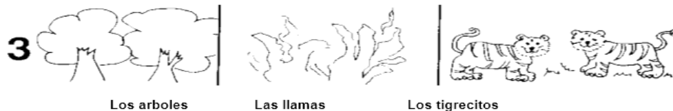
Imagen 1. Diagnóstico para la comprensión lectora en primaria. Cuento tomado de Marta Lucía Ghiglioni.

4.- Los que causaron el incendio fueron: