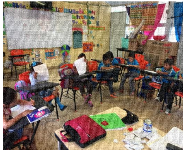
Imagen 2. Alumnos escribiendo sus diálogos.

Para ayudarlos con los diálogos, en el cuento: Las aventuras de Lola invité a que reflexionaran sobre la actitud de los padres de la protagonista, sobre la conversación que los padres entablarían, por qué creían que había un castigo. Los alumnos me fueron comentando los diálogos a partir del cuento, de por qué los papás idearon un plan para dar una lección y de la desobediencia de la protagonista. Idearon un diálogo con la amiga de la protagonista, Fernanda, cuyo papel consistía animarla a hablar con sus papás y disculparse por su actitud. Esto lo idearon del texto donde decía que su amiga le había dado un consejo. Así sucesivamente se fueron escribiendo los diálogos. Al final se obtuvo un guion de teatro, en donde cada personaje tenía escrita su intervención.