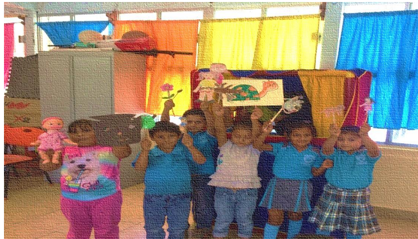
Imagen 5. Los niños de segundo grado en la presentación del teatro guiñol.

Con las presentaciones concluimos la actividad del teatro guiñol.