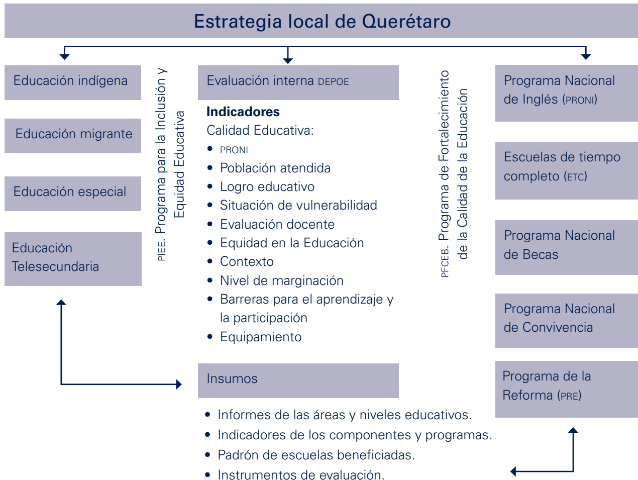
Esquema 3. Función y participación en el seguimiento de la estrategia local de la aplicación de los programas federales y estatales