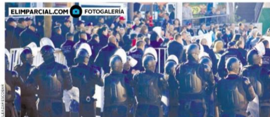
• Maestros en contra de la evaluación docente se manifestaron en la UES, donde se realizó el examen. Esto en medio de un fuerte operativo policial para custodiar la sede, en Hermosillo.

En el caso de Hermosillo en la Universidad Estatal de Sonora (UES) fue evidente la presencia de cuerpos policíacos en al menos dos cuadras a la redonda.