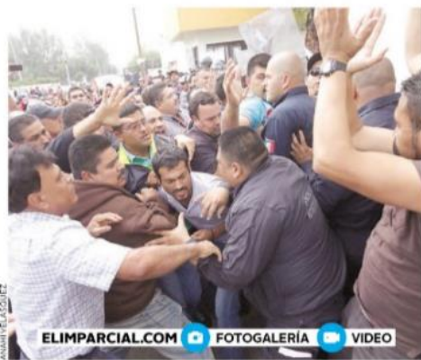
• Jaloneos y gritos entre manifestantes y agentes de la Policía Estatal, ocurrieron afuera de la Universidad Estatal de Sonora.

Realizan boicot en algunas de las sedes del Estado Protestan por evaluación docente