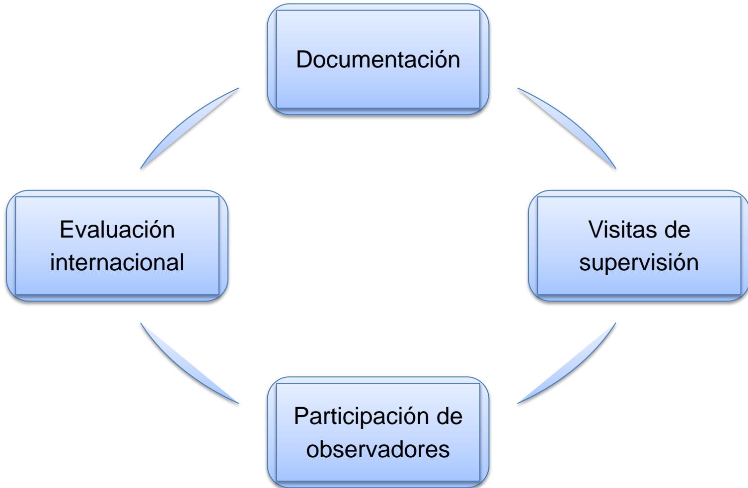
Figura 2. Elementos que integran la estrategia de supervisión y observación