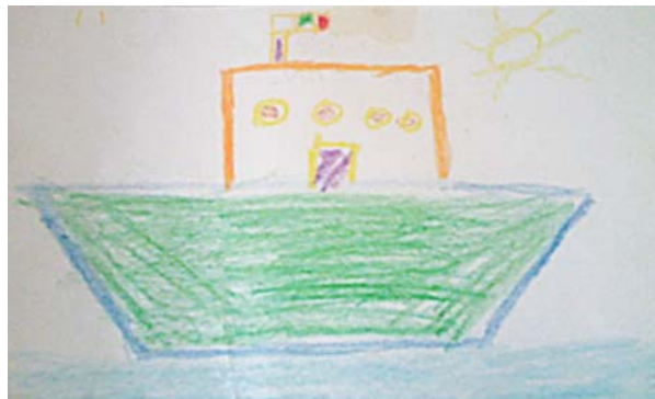
"Me gusta mucho el barco porque podemos ir al mar" Albizu Martínez de 9 años