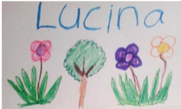
“Me gustan los árboles” Lucina

—Los ojos de agua cuando están limpios podemos acudir a ellos a tomar agua, es por eso que los debemos de cuidar. Y para eso debe haber plantas, de donde el agua sale, porque sabemos que en las raíces de las plantas y el árbol se retiene el agua y de ahí sale. 59