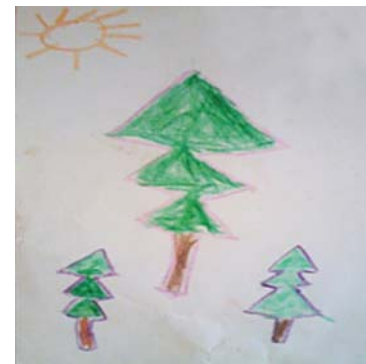
"Me identifico con el pino porque es bonito" Lourdes Jacinto Alejo