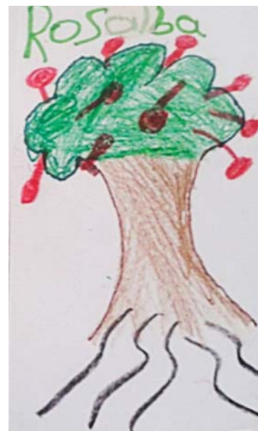
“Los arboles nos dan aire para respirar” Rosalba