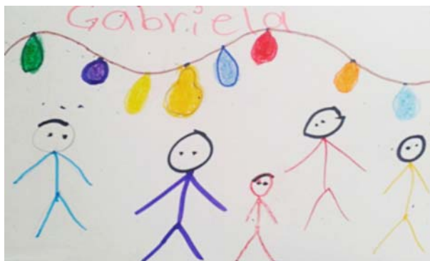
“La fiesta de mi comunidad y la danza de los moros”

Que en la escuela nos enseñen que la danza de los moros es importante porque algunos de nosotros la sabemos bailar y es muy bonita.