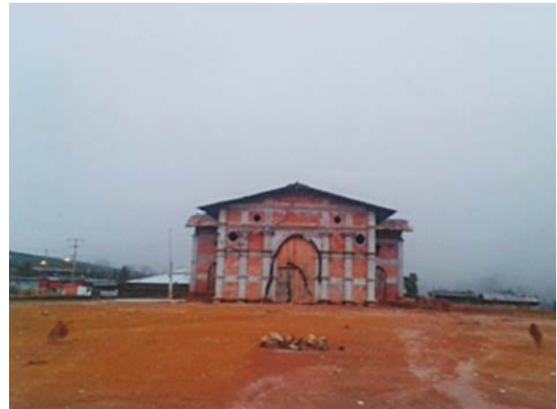
Fotos de la Comisaría y la iglesia de la comunidad de Yozondacua Nuevo, tomadas por dos jóvenes

Después de que se tomaron las fotos, se siguió con la dinámica de en dónde aprenden lo que más les gusta aprender a los niños y jóvenes. Las preguntas se hacían de manera que no sintieran que fueran preguntas directas, sino más bien una plática donde ellos se sintieran en confianza.