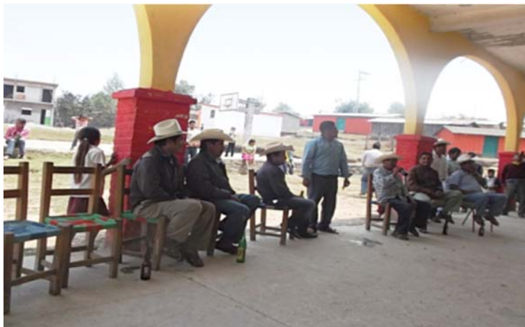
Habitantes de la comunidad en asamblea.