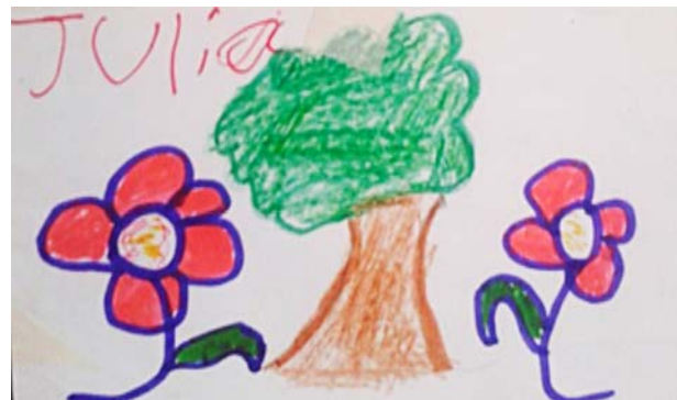
“Son muy bonitos los árboles y las flores” Julia