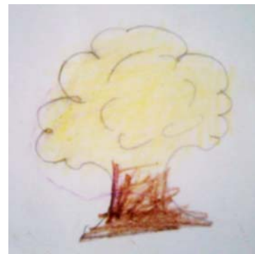
Dibujo de un niño: "El árbol"