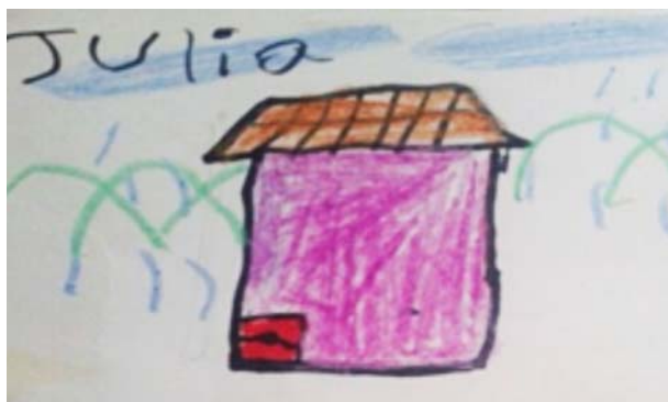
“Que en la escuela me enseñen a leer y escribir” Julia