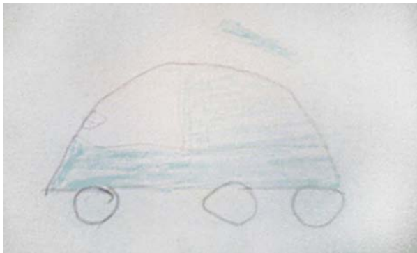
Dibujo de un carro

Los jóvenes y niños dibujaron en su mayoría flores y árboles, que son cosas con las que se identifican, ya que es parte de su comunidad, en la cual cada uno dijo el porqué de ese dibujo, expresando que las flores son bonitas, que los árboles son parte de su vida, porque al igual que ellos los arboles también respiran. En los jóvenes (hombres) que participaron, uno de ellos se identificó con un carro por el hecho de que al igual que el carro él también camina.