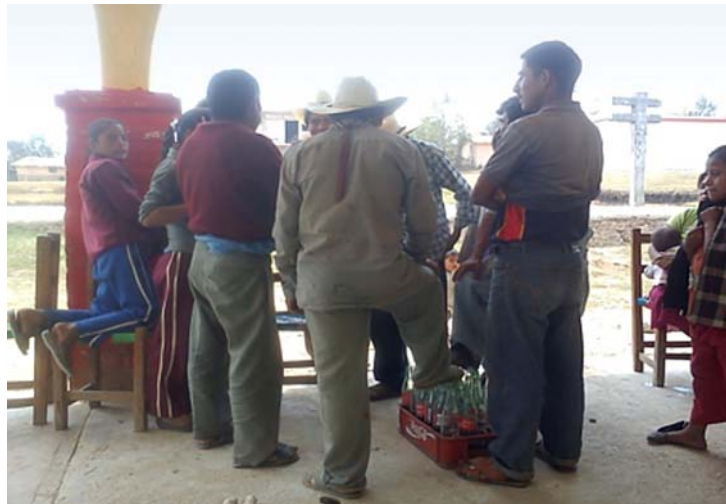
Señores que integran el gabinete de la Comisaría (20 de mayo de 2013).

En la comunidad existen ciertos criterios para llegar a ser autoridad; es decir, que aún se siguen practicando lo que son los usos y costumbres que han dejado los abuelos, por eso “para empezar las personas a prestar su servicio comunitario, no importa si son casados o solteros. Comienzan primero desde el cargo más bajo, como el de topil, quien tiene como función encargarse de ir a los mandados, ya sea por refrescos, cerveza y barrer la comisaría; el policía segundo es el encargado de ir a traer a las personas cuando hay algún problema, a veces acompañado del primer policía: el segundo comandante tiene el mismo cargo que los policías; el segundo regidor y primer regidor son los encargados del padrón de la comunidad, dan aviso sobre la fiesta o alguna reunión; el suplente del comisario