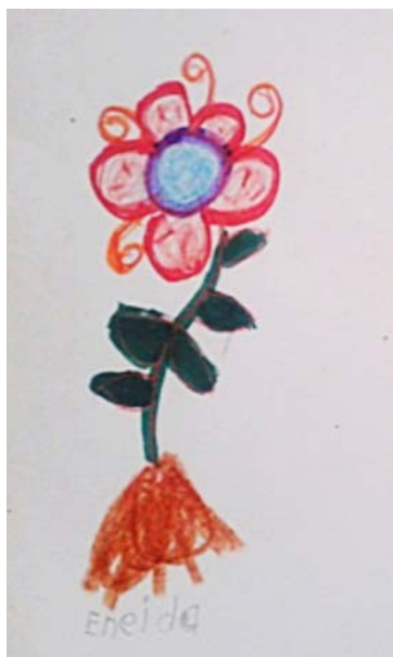
“La flor es bonita y me gusta” Eneida