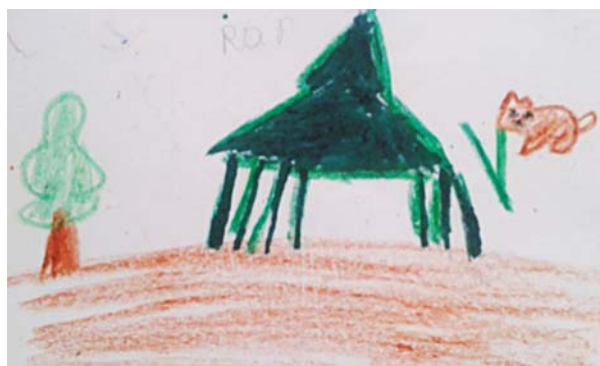
“Que el maestro juegue con nosotros” Rafaela

Cuando se lleven a cabo las reuniones de escuela queremos estar presentes para dar nuestras opiniones.