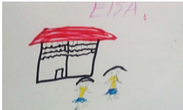
“Que mi mamá y mi papá vayan a la escuela” Elsa