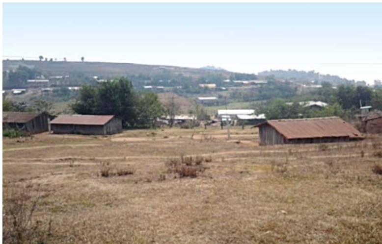
Vista panorámica de la comunidad de Yozondacua Nuevo.

La comunidad de Yozondacua Nuevo está situada en el municipio de Cochoapa El Grande, en el estado de Guerrero. Cuenta con aproximadamente 482 habitantes. Sus colindancias son: al norte con Rancho de Guadalupe, al sur con Yozondacua El Carmen, al este con Cahuañaña y al oeste con Barraca de la Palma.