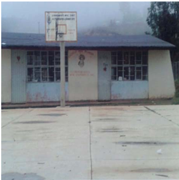
“Le tomé una foto a la escuela porque me gusta ir a la escuela” Olivia Santiago Moreno, 11 años